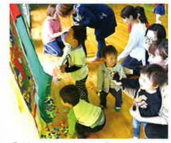
③技みがきジャンプ