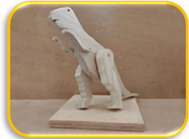
ティラノサウルス